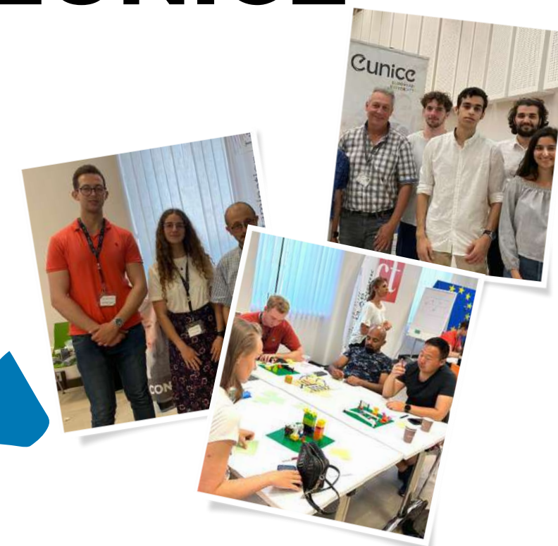
EUNICE Imagine Innovation Cup EUNICE Contamination Lab