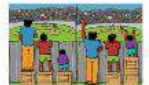
equity vs. equality