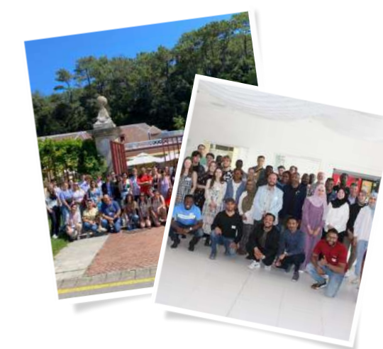
Blended Intensive Programmes à Santander (Espagne) et Cottbus (Allemagne)